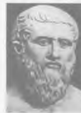
Платон (428 или 427—348 или 347 до н. э.)

В Академии древнегреческого философа Платона, например, занятия часто проходили в саду. Великий философ Аристотель пришёл в платоновскую Академию 17-летним