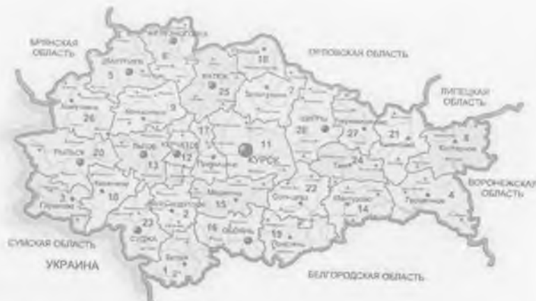
Курская область - районы на карте