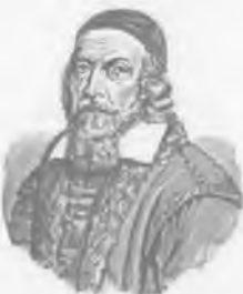
Ян Амос Коменский

Археологические раскопки говорят о том, что первые школы появились в странах Древнего Востока — Вавлонии, Ассирии, Египте, Индии.