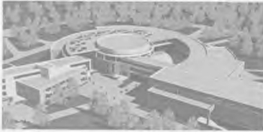
Проект нового школьного здания

Особенностью новых школ являются библиотеки, тренажёрные залы, бассейны, учебные кабинеты и лаборатории, открытый доступ в Интернет, электронные учебные пособия, персональные компьютеры и другое оборудование.