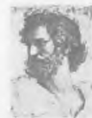
Аристотель (348—322 до н. э.)

юношей и остался там на 20 лет. А со своими учениками Аристотель проводил занятия во время общей прогулки. Учитель и ученики его школы получили название «перипатетики», или «прохаживающиеся».