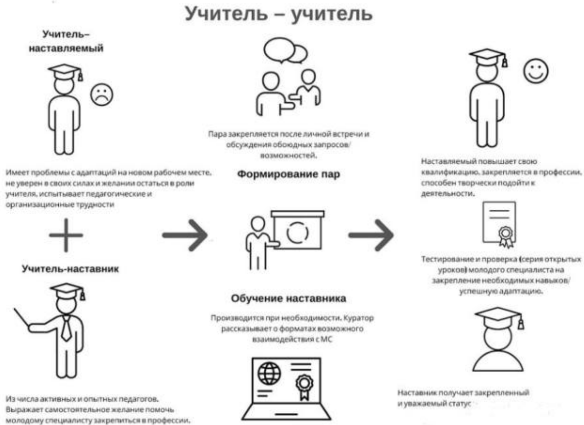
Рисунок 2. Графическое представление взаимодействия по форме «учитель – учитель»