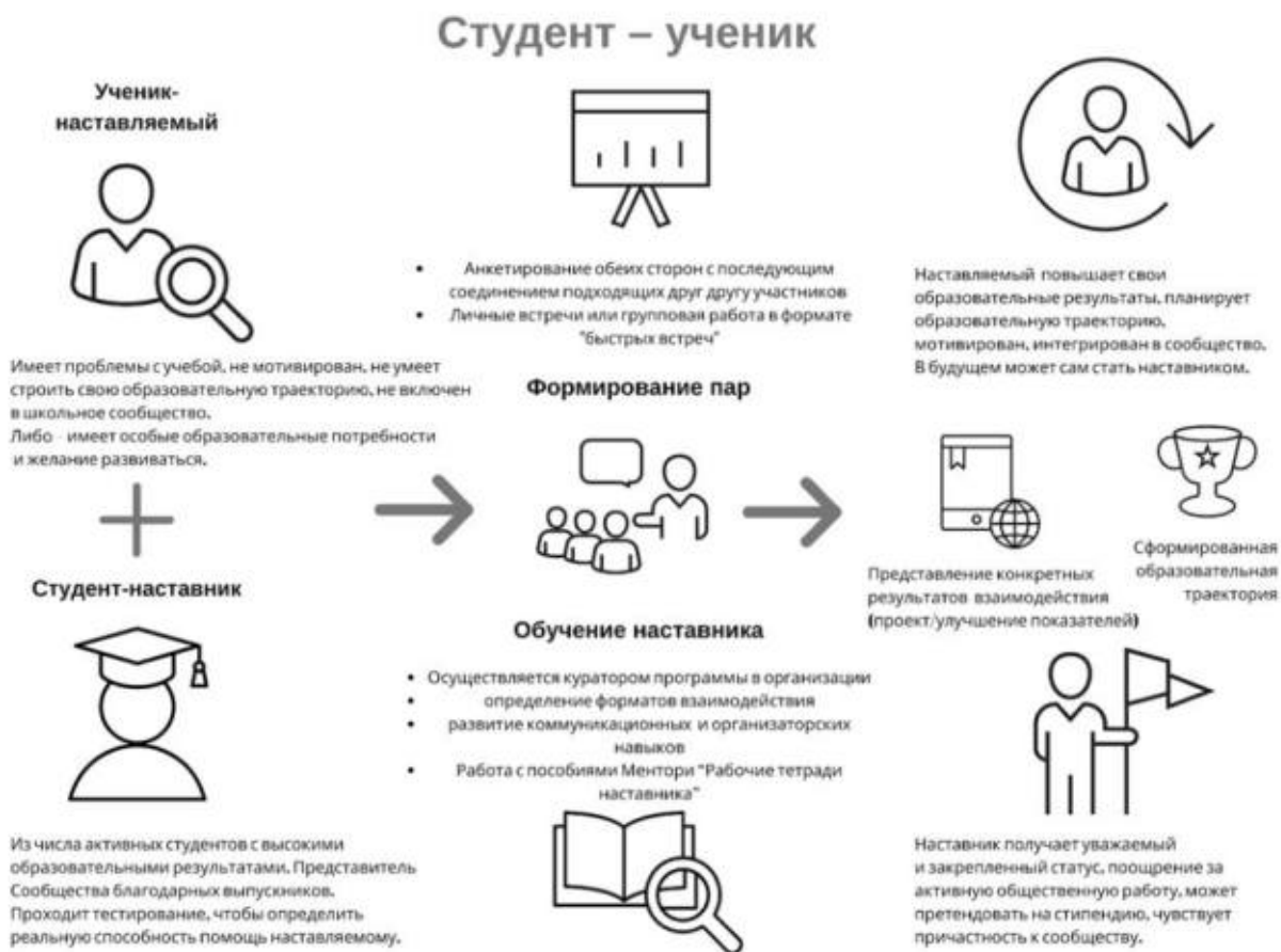
Рисунок 3. Графическое представление наставнического взаимодействия по форме «студент – ученик»