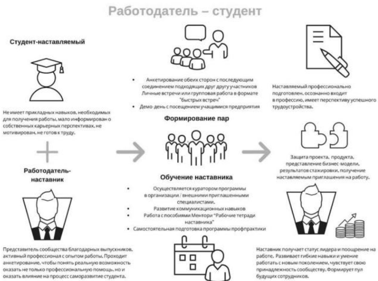
Рисунок 5. Графическое представление наставнического взаимодействия по форме «работодатель – студент»