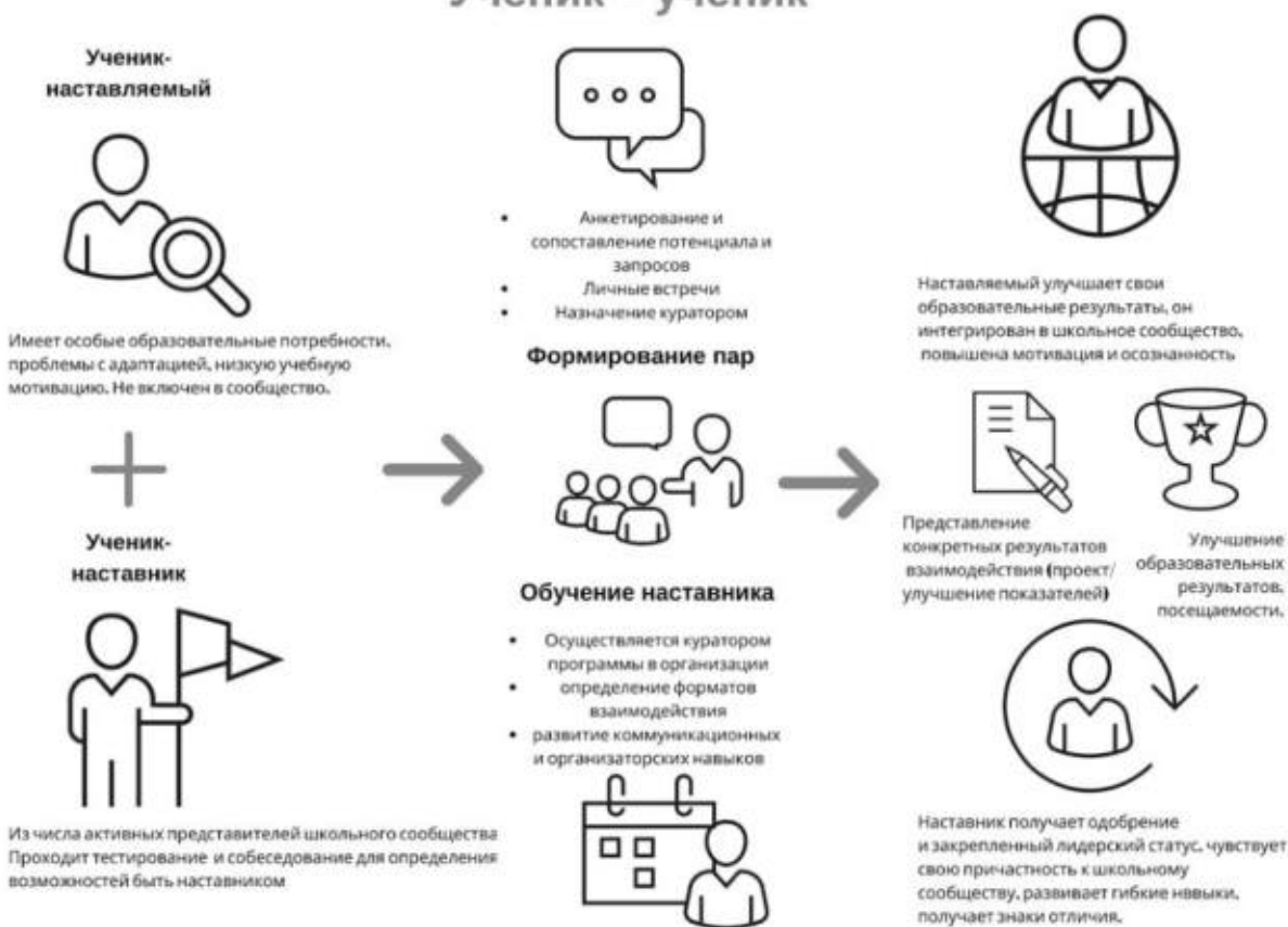
Рисунок 1. Графическое представление взаимодействия по форме «ученик – ученик»