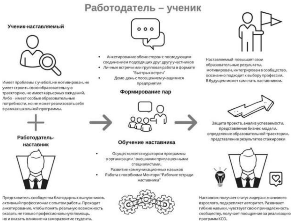
Рисунок 4. Графическое представление наставнического взаимодействия по форме «работодатель – ученик»