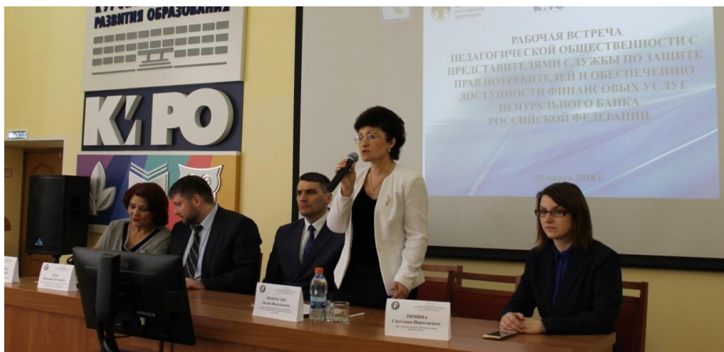
Реализация проекта «Онлайн-уроки финансовой грамотности. Профессионалы финансового рынка идут в школы»

Решению задачи научно-методического сопровождения деятельности образовательных организаций по развитию финансовой грамотности обучающихся способствовало эффективное взаимодействие со специалистами Отделения по Курской области Главного управления Центрального банка Российской Федерации по Центральному федеральному округу. Налаженная организационная работа с общеобразовательными и профессиональными образовательными организациями Курской области позволила региону выйти на лидирующие позиции по реализации проекта «Онлайн уроки финансовой грамотности. Профессионалы финансового рынка идут в школы». По итогам осенней сессии 2017 – 2018 учебного года Курская область по числу участников онлайн уроков и по количеству образовательных организаций, участвующих в проекте, занимает первое место среди субъектов РФ.