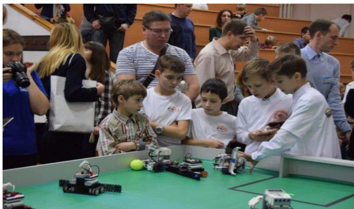
I-й региональный образовательный фестиваль образовательной робототехники «РобоТех»

В целях развития информатизации образования в регионе сотрудниками института во взаимодействии с гимназией № 4 г. Курска подготовлены методические рекомендации по ведению образовательными организациями электронного дневника и электронного журнала успеваемости. Преподаватели кафедры информатизации участвовали в организации и проведении видеоконференций по развитию робототехники в системе общего и дополнительного образования, в фестивалях по медиаторчеству и программированию среди обучающихся: «24 bit», «Юность, наука, информатика», I-й региональный образовательный фестиваль образовательной робототехники «РобоТех».