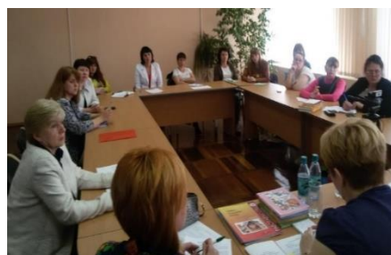
Межрегиональный круглый стол «Семейные традиции развития читательской культуры»