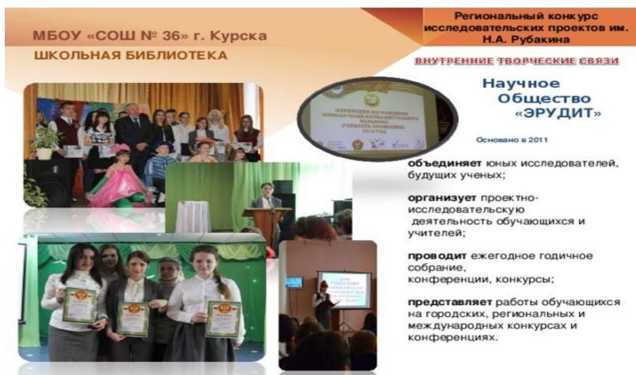
Региональный конкурс исследовательских проектов им. Н.А. Рубакина

В 2017 году проведен II региональный профессиональный конкурс библиотечных исследовательских проектов им. Н.А. Рубакина среди специалистов библиотек общеобразовательных организаций. Осуществлялась разработка региональной АБИС.