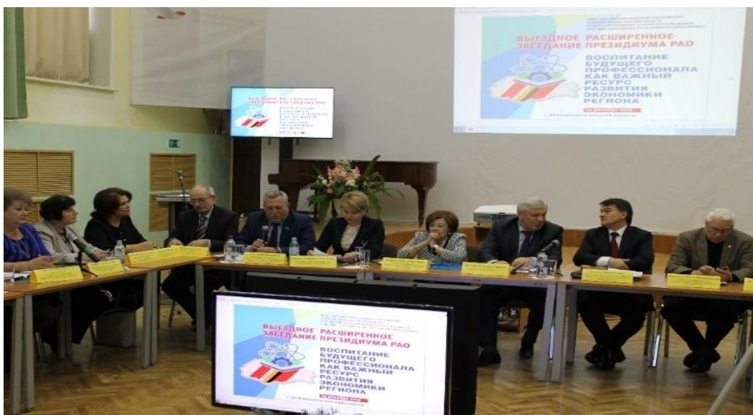
Расширенное заседание президиума РАО по проблеме воспитания будущих профессионалов