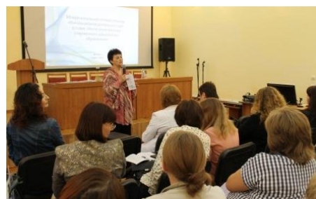
Обсуждение результатов проекта «Лонгитюдное исследование качества дошкольного образования»

В рамках реализации задач, поставленных в Стратегии действий в интересах детей до 2018 года, на 11 апробационных площадках проходила апробация региональной образовательной программы «Формирование культуры семейной жизни и ответственного родительства». Организован цикл семинаров-практикумов с 35 классными руководителями г. Курска, проведено 3 встречи по проблемам взаимодействия с родителями обучающихся. Состоялся областной конкурс методических разработок мероприятий, посвященных семье и традиционным семейным ценностям. В мае 2017 года проведен межрегиональный круглый стол «Семейные традиции развития читательской культуры», посвященный вопросам формирования культуры семейного чтения на разных уровнях образования.