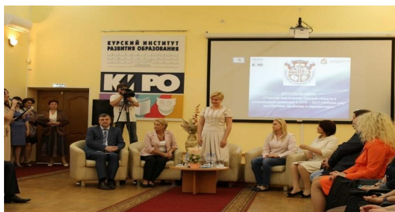
Круглый стол «Участие школьников Курской области в олимпиадном движении» в 2016-2017 уч.году

Итогом системной деятельности по научно-методическому сопровождению работы с одаренными детьми стали высокие результаты участия школьников Курской области в заключительном этапе всероссийской олимпиады школьников. В нем приняло участие 19 обучающихся, 3 из которых стали победителями и 9 - призерами. Это лучшее выступление команды Курской области в данном мероприятии за последние 10 лет. В мае 2017 в КИРО состоялся круглый стол «Участие школьников Курской области в олимпиадном движении в 2016-2017 учебном году: достижения, проблемы и перспективы». По результатам круглого стола в региональном журнале «Педагогический поиск» опубликована рубрика, посвященная работе с одаренными детьми в регионе.