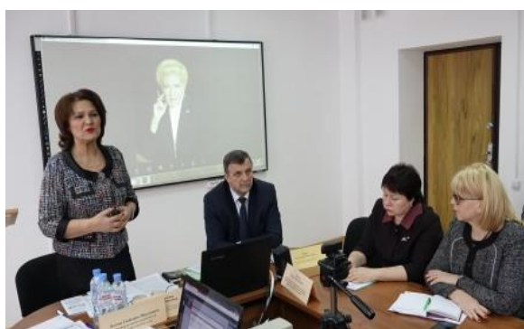
IX Всероссийские Шамовские чтения «Перспективы развития современного образования: от дошкольного до высшего»

IX Всероссийские Шамовские чтения «Перспективы развития современного образования: от дошкольного до высшего». Секция № 12 «Управление образовательной организацией в условиях концептуальных изменений в образовании»;