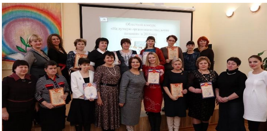
Областной конкурс «На лучшую организацию школьного питания»

В КИРО сложилась система работы по научно-методическому сопровождению деятельности ОО по организации школьного питания – функционирует региональная стажировочная площадка «Организация школьного питания». В рамках работы СП осуществлялась диссеминация опыта ОО по организации горячего питания, формированию культуры здорового питания у обучающихся. В декабре 2017 года проведен VI областной конкурс «На лучшую организацию школьного питания». В конкурсе приняли участие 24 школы: 10 городских и 14 сельских.