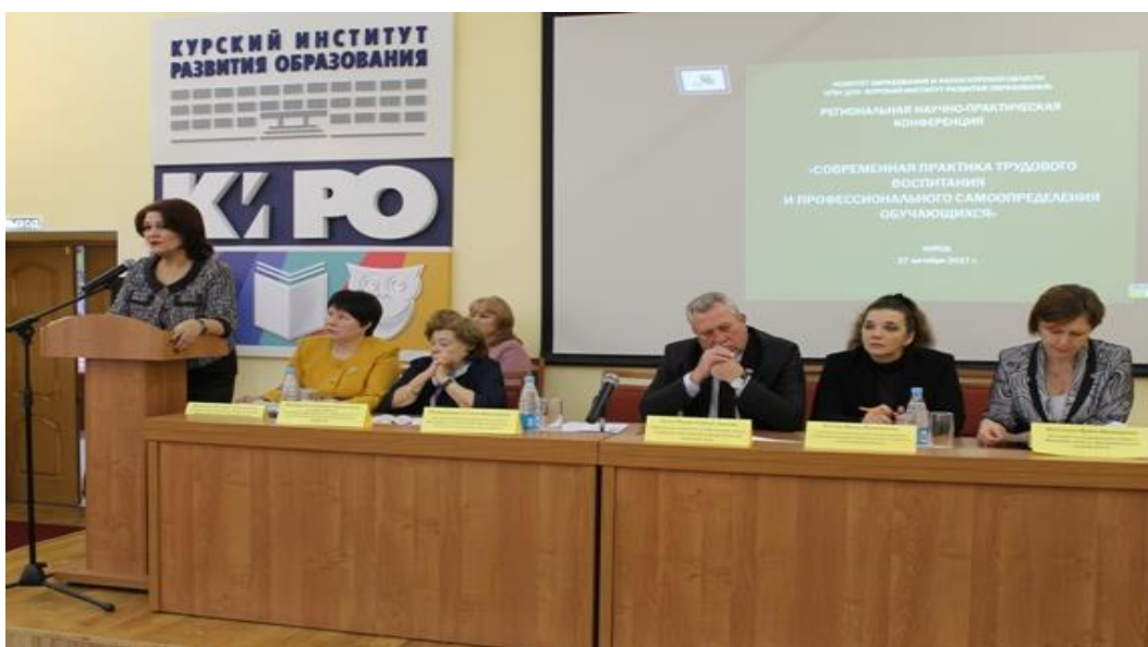
Региональная конференция «Современные практики трудового воспитания и профессионального самоопределения обучающихся»

Опыт работы площадок был представлен на августовской дискуссионной площадке, на региональной конференции «Современные практики трудового воспитания и профессионального самоопределения обучающихся», на мероприятиях в рамках расширенного заседания президиума РАО в декабре 2017 года.