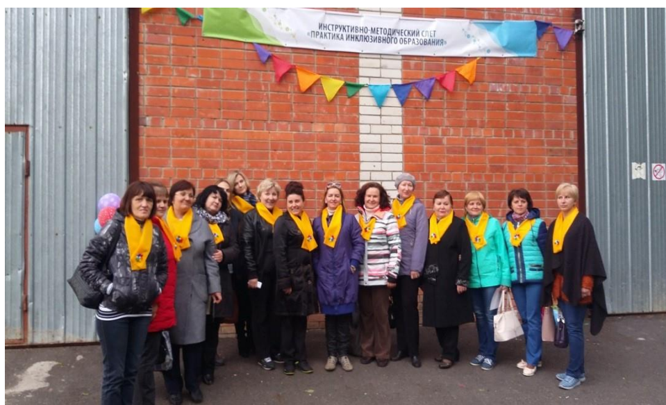
Инструктивно-методический слет «Практика инклюзивного образования»

В рамках научно-методического сопровождения инклюзивного образования преподаватели КИРО участвовали в проведении инструктивно-методического слета «Практика инклюзивного образования», проектной мастерской «Актуальные проблемы психолого-педагогического сопровождения детей с ОВЗ и инвалидностью в условиях введения и реализации ФГОС ОВЗ», межрегиональном интерактивном круглом столе «Психическая депривация детей, находящихся в трудной жизненной ситуации: инновационные образовательные технологии профилактики, реабилитации, сопровождения».