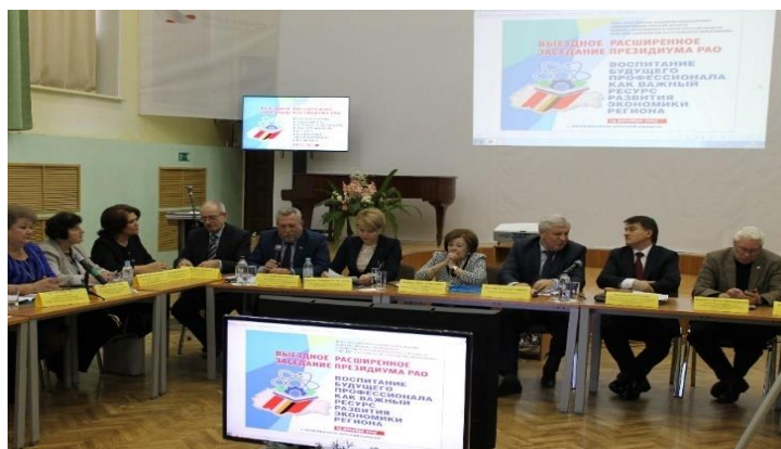
Расширенное заседание президиума РАО 14 декабря 2017 года (г. Железногорск)

В 2017 году сотрудниками КИРО во взаимодействии с отделением профессионального образования РАО под научным руководством академика РАО С.Н.Чистяковой разработан региональный проект «Воспитание будущего профессионала как важный ресурс развития экономики региона». 14 декабря 2017 года при поддержке комитета образования и науки, администрации г. Железногорска организовано и проведено расширенное заседание президиума РАО «Воспитание будущего профессионала как важный ресурс развития экономики региона».