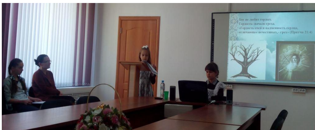
Конкурс проектных и исследовательских работ в области духовно-нравственного воспитания «Лествица»

В рамках реализации государственной программы Курской области «Развитие образования в Курской области» разработано и издано учебно-методическое пособие, включающее материалы по географии, истории и культуре Курского края «Я – курянин». Апробация пособия в 2017 году осуществляется на шести стажировочных площадках, действующих в ОО области.