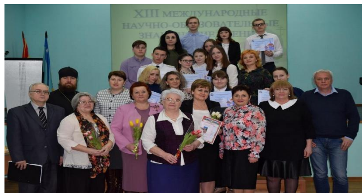
XIII Международные научно-образовательные Знаменские чтения

Кафедрой профессионального образования подготовлены и проведены мероприятия, направленные на решение задач воспитания в системе СПО (областные педагогические чтения «Консолидация усилий общества, церкви и государства в вопросе духовного развития России XXI века») в рамках XIII Международных научно-образовательных Знаменских чтений; студенческие краеведческие чтения по проблеме «1917-2017 годы в истории моей малой родины»; региональный этап XXVI Международных Рождественских образовательных чтений на тему «Непрерывный нравственный выбор как высшее проявление личностного развития будущего профессионала»).