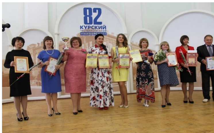
Лучшие педагоги Курской области – победители конкурсов профессионального мастерства 2017 г.

Методическая работа специалистов КИРО способствовала повышению уровня методологической культуры учителей, росту количества и популярности профессиональных конкурсов; формированию у педагогических работников отношения к профессиональным конкурсам как средству совершенствования компетенции, распространения педагогического опыта.