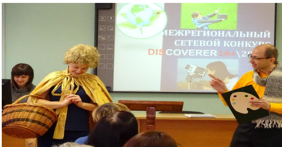
Межрегиональный сетевой конкурс «Discoverer 14+ \2017»

Институтом осуществлялась системная деятельность по научно-методической поддержке школ с низкими результатами обучения: подготовлены предложения в проекты нормативных актов, направленных на развитие системы сетевого взаимодействия образовательных организаций по вопросам повышения качества, эффективности и доступности образования в школ с низкими результатами обучения, разработан диагностический инструментарий для изучения особенностей деятельности данных школ, проведены 3 методических семинара по вопросам обеспечения качества в образовательных организациях со стабильно низкими результатами обучения, разработаны 2 методических пособия.