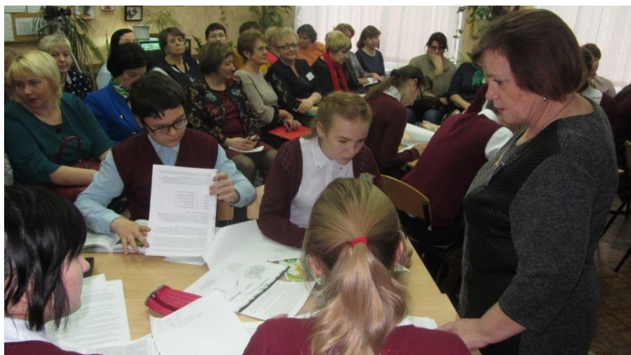
Работа «Школы эффективного учителя»

Начала свою работу «Школа эффективного учителя», в рамках деятельности которой состоялись семинары, мастер-классы, круглые столы.