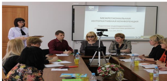
Межрегиональная интерактивная конференция «Педагогика индивидуальности: достижения и перспективы развития»