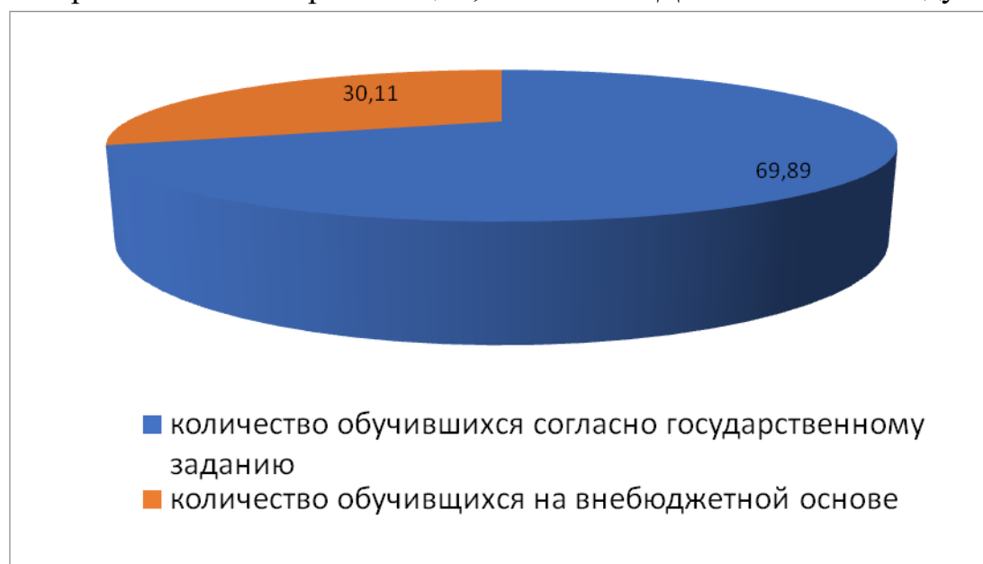
Диаграмма 2. Количество педагогических работников и руководителей образовательных организаций, освоивших ДПП ПП в 2023 году

В 2023 году обеспечена реализация 114 адресных ДПП ПК и 6 ДПП ПП (106 ДПП ПК и 4 ДПП ПП в рамках государственного задания, 2 ДПП ПК в рамках мероприятия 1.2 «Развитие общего образования. Обеспечение деятельности учреждений, подведомственных Министерству образования и науки Курской области», предусмотренного подпрограммой 1 «Развитие дошкольного и общего образования детей», 7*адресных ДПП ПК и 3*ДПП ПП были разработаны и реализованы на внебюджетной основе) (*в том числе 1 ДПП