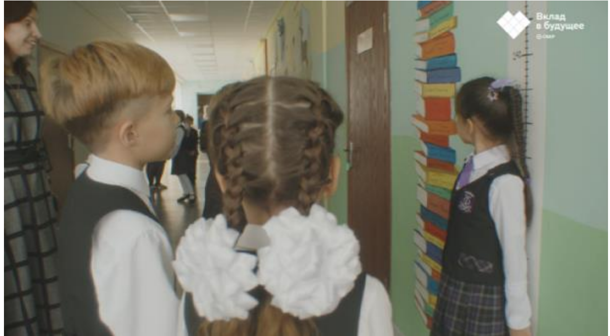
Пушкинский пролицей № 78 г. Набережные Челны, Республика Татарстан