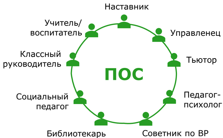
Профессиональные Обучающиеся Сообщества