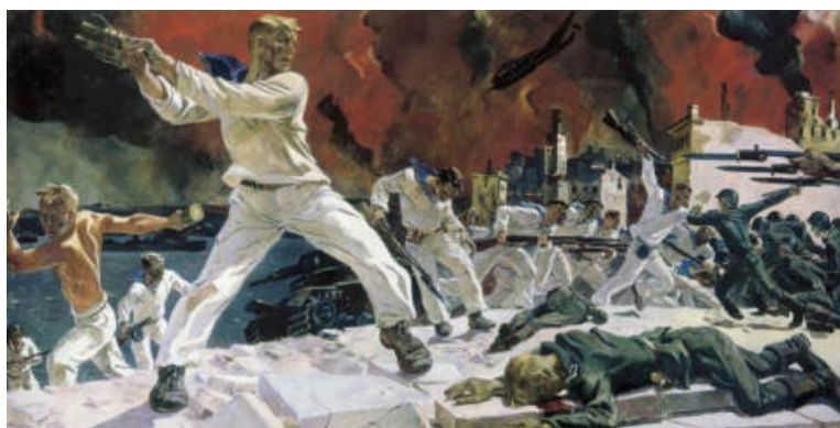
Рисунок 4, Александр Дейнека. «Оборона Севастополя» 1942 г.