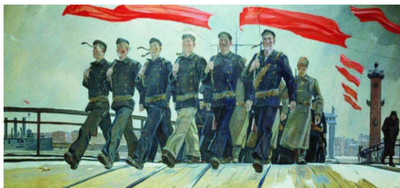
Рисунок 3, А. Дейнека –«Левый марш» 1941 г.

Еще во время учёбы Дейнека общался с поэтом Маяковским, что оказало на художника огромное влияние. Их вдохновляли одни и те же темы – любовь к пролетариату, вера в советскую власть, здоровье человека и здоровый образ жизни. Не удивительно, что одна из лучших картин Дейнеки получила то же название, что и известное стихотворение Маяковского – «Левый марш» (1941).