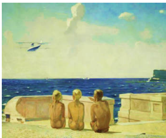
Рисунок 6, Александр Дейнека – Живопись. «Будущие летчики» 1937 г.

В тридцатые годы двадцатого века А. Дейнека пишет серию картин на тему авиации («Гражданская авиация» (1932), «Бомбовоз», 1932, «Гидропланы», 1934). Одним из лучших произведений художника становится картина «Будущие летчики» (1937), где трое подростков сидят спиной к зрителю и смотрят вслед улетающему самолету.