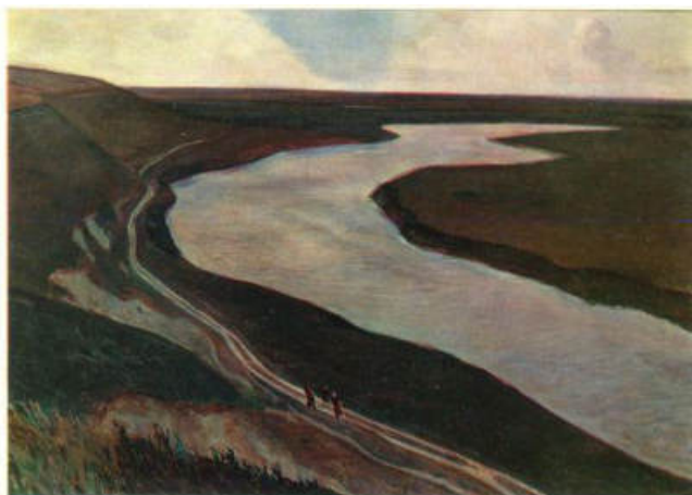
Рисунок 7, А. Дейнека – Живопись. «Под Курском. Река Тускорь». 1945 г.

Победа в войне вдохновила художника на создание серии картин с видами на взятый Берлин («Берлин» 1945). Также художник изобразил освобожденные просторы Курской земли («Под Курском. Река Тускорь». 1945).