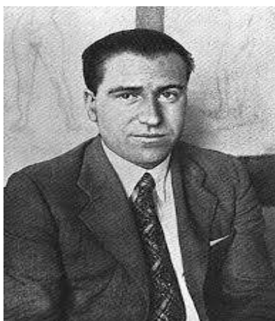
Рисунок 1, А. А. Дейнека

В 1919-1920 гг. Александр был мобилизован на службу в Красную Армию, принял участие в обороне родного Курска от белых войск. Память о Великой отечественной войне отразилось и в его дальнейшем творчестве.