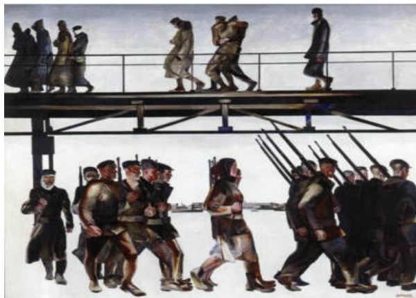
Рисунок 2, А. Дейнека «Оборона Петрограда» 1928 г. [2, с.1].

В 1928 году А. Дейнека написал патетическую историко-революционную картину, которую впоследствии назовёт "своей любимой вещью" - полотно "Оборона Петрограда" с изображением шеренги петроградских рабочих, уходящих на борьбу с Юденичем.