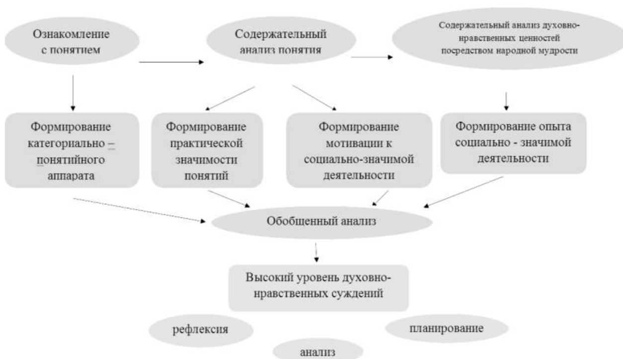
Рис.1. Условия и результаты формирования духовно-нравственных ценностей через развитие теоретического мышления и сознания.

Работу по развитию духовно-нравственных ценностей необходимо вести в строго определенной последовательности, где один прием строится на другом (от знаний и умений к действию).