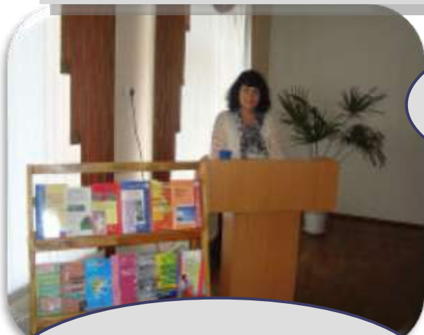
Модератор РИСП Освещение в СМИ

Проектная деятельность. Разработка и создание рекомендаций, буклетов