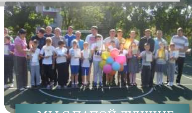
«МЫ С ПАПОЙ ЛУЧШИЕ ДРУЗЬЯ!»