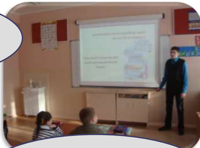
Проведение классных часов, выступление на родительских собраниях