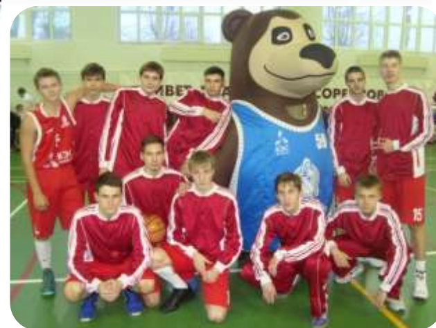
Победители ШБЛ «КЭС-БАСКЕТ» муниципального этапа 2016-2017