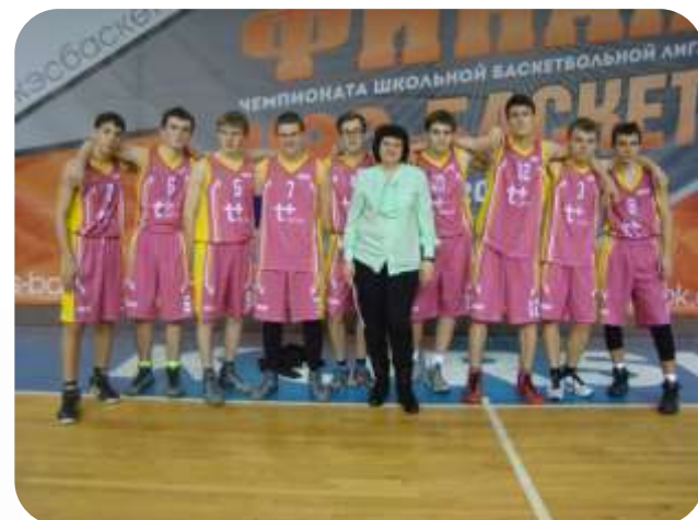
Победители ШБЛ «КЭС-БАСКЕТ» дивизионного этапа и участники финала регионального этапа 2015-2016 г.