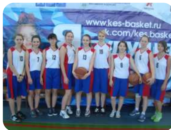
Призеры ШБЛ «КЭС-БАСКЕТ» муниципального этапа 2015-2016