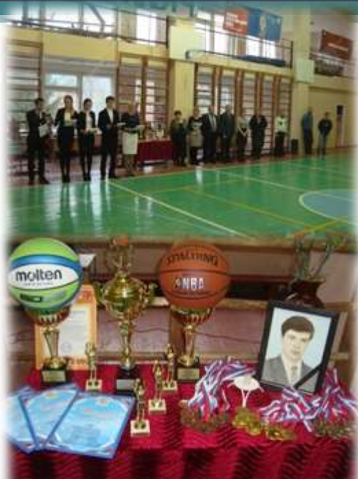
Организатор ежегодного городского турнира по баскетболу памяти Игоря Пахомова